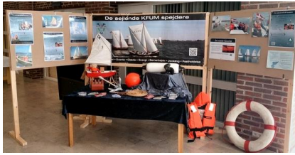
Vores stand i vestibulen på Landsmødet.